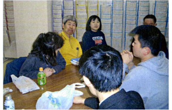
明るく楽しく・にぎやかに会は進みます。