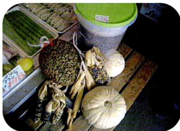
釧路で採れた野菜達と大豆を使った味噌

☆ちなみに、かぼちゃジュースで空を飛べるのは心が純粋な人だけだそうです。（僕は飛べなさそう…）