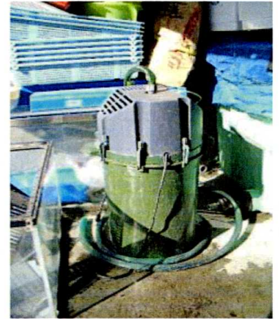
水族館から寄贈のプロ仕様ポンプです！

シャケ、育ててみませんか？ 自分もシャケも同じ環境の中で共に生きていることが実感できます！！