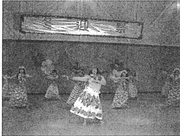
もうここは南国です♪

—「今回は例年より遅めの開催だったので、暖かさが一段と感じられる内容にして、寒い冬を乗り越えられる“元気”を皆さんが持てるようにと願いを込めた。1993年のラムサール会議を機に発足した会も10年が経ち、当初の頃に比べると変化が感じられる。市民にも英語から転勤でやってくるや中国語などが堪能サール会議当時、環境たちも、今でも自主的である。また、海外かでも、日本に対する理の課題は関連ボラン